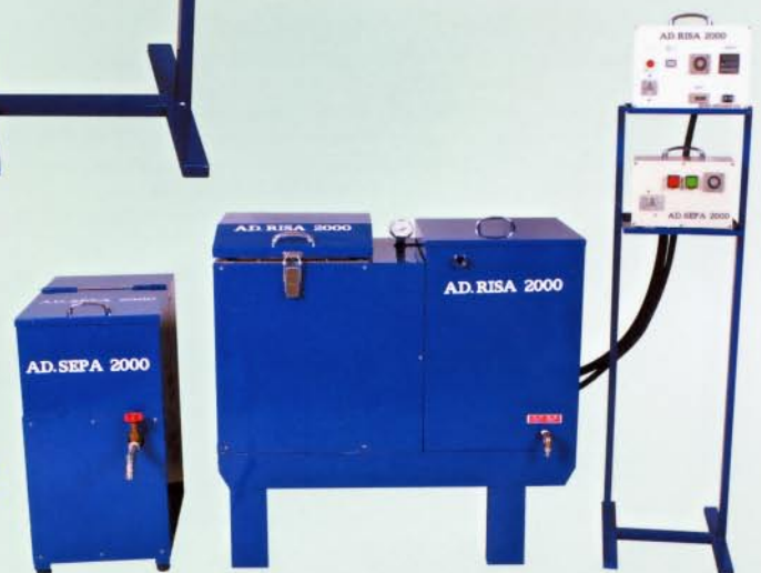
Combination of AD.SEPA and AD.RISA AD.SEPAとAD.RISAのセット

This simple, safe distilling device for recycling not only reduces costs and saves resources, but also helps to alleviate the serious problem of air pollution.